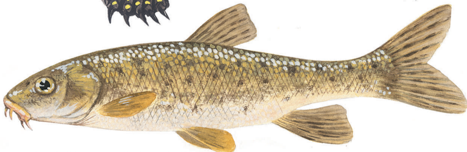
fig. 2 Barb de muntanya ( Barbus meridionalis ) endèmica del litoral mediterrani de França i Catalunya