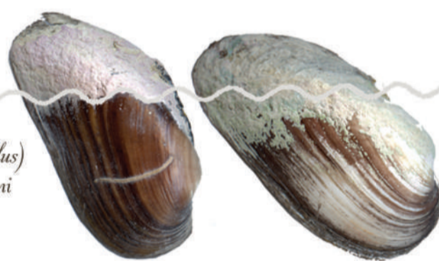
fig. 3 Nàiada ( Unio elongatulus ) endèmica del litoral mediterrani