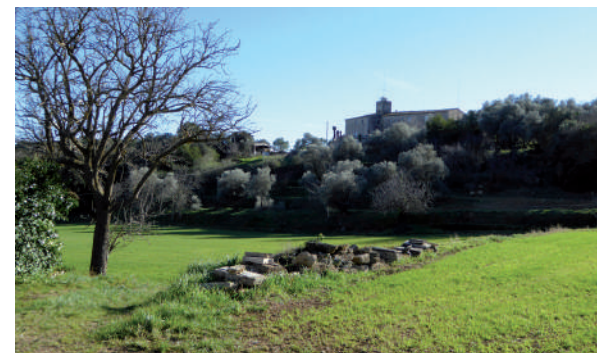
A dalt, estanyol de la Cendra. Al mig, pont sobre el rec de la Perpinyana. A baix, Can Campolier de Miànigues.