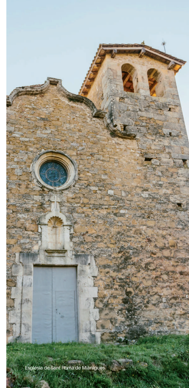
Església de Sant Romà de Miànigues.