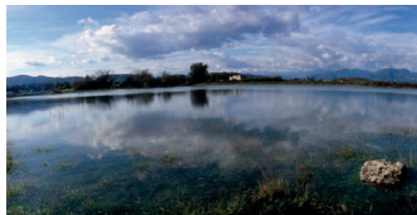
A dalt, estanyol del Vilar. Al mig, església de Santa Maria de Porqueres. A baix, platja d'Espolla.