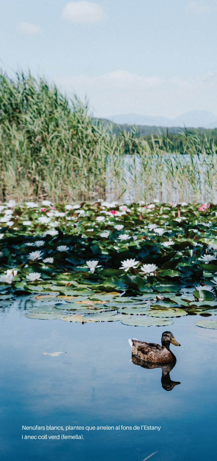
Nenúfars blancs, plantes que arreen al fons de l'Estany i ànec coll verd (femella).