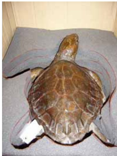
Embalatge de la tortuga careta per al seu trasllat