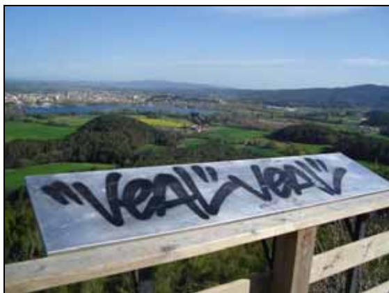
Vinil arrencat al plafó de Puig Clarà