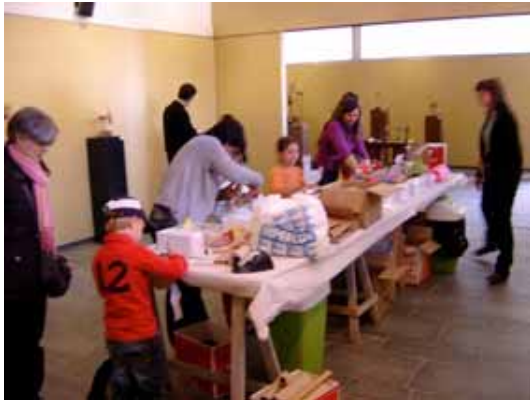
3. Taller de Setmana Santa