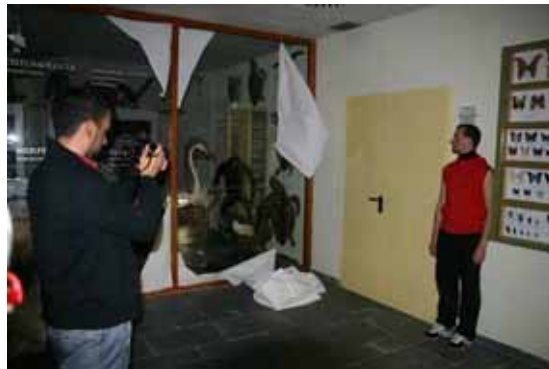
5. Dansa i poesia: Història Natural