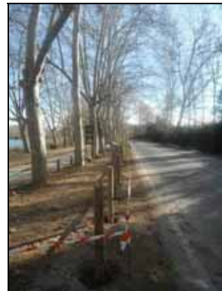
Treballs d'instal·lació de la tanca