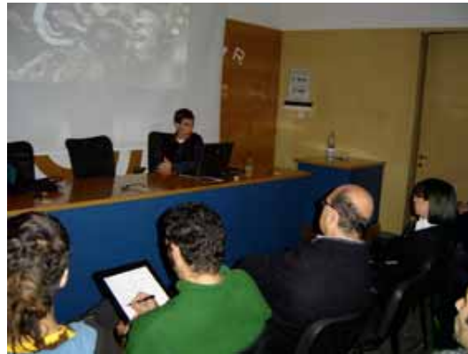
2. Curs "El regne dels fongs"