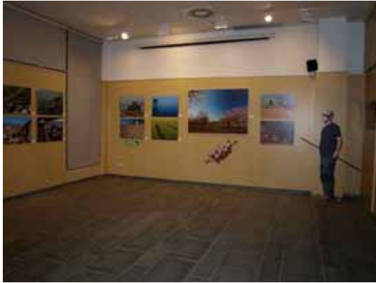
1. Catalunya Terra Pagesa