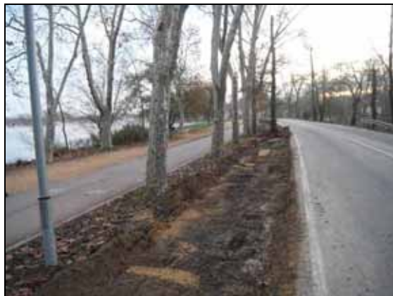
Raspat del sòl compactat

L'actuació ha estat possible gràcies al "Trasllat d'actuacions" (veieu apartat 1).