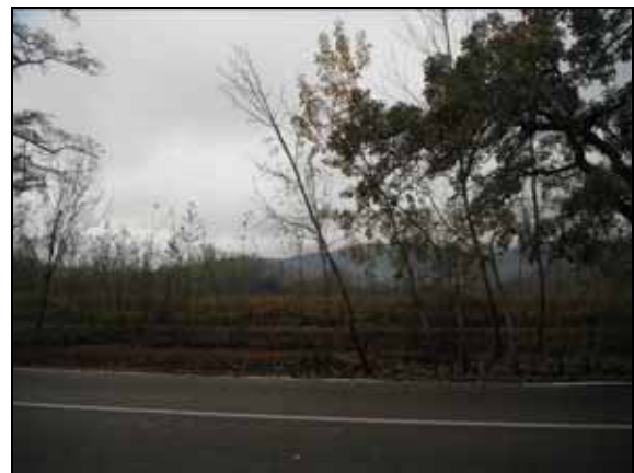
Vista de la zona després de l'actuació