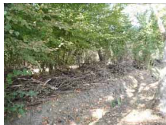
Retirada de biomassa acumulada