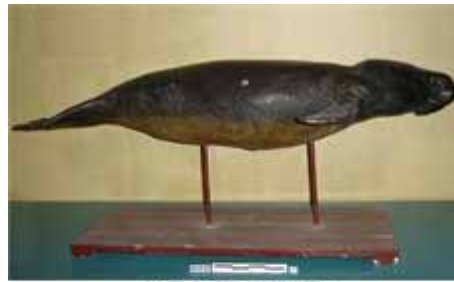
abans de la restauració