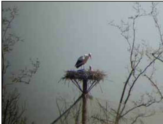
Parella de cigonyes al niu

Aquest 2011 el mascle s'ha aparellat amb una nova femella alliberada durant el 2010 a Banyoles (90M3). No és un fet habitual ja que les cigonyes creen parelles estables. Ja sigui pel canvi de parella, per la immaduresa de la femella o perquè durant l'època d'incubació va coincidir amb un període llarg de pluges, no hi ha hagut èxit reproductiu de la nova parella.