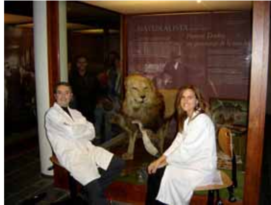
4. Teatre: Memòries del Darder