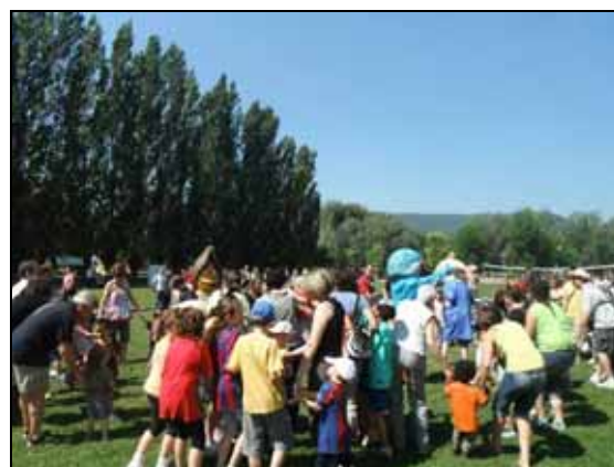
Presentació de la diada amb en Blauet