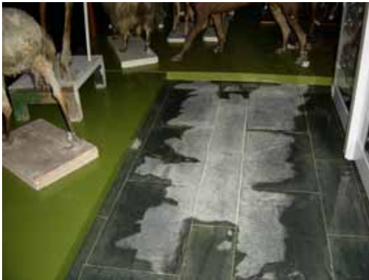
Entrada d'aigua al magatzem visible després de la inundació