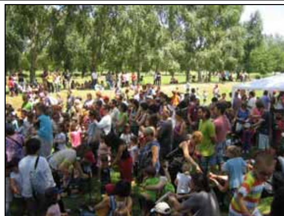
Participants a la diada