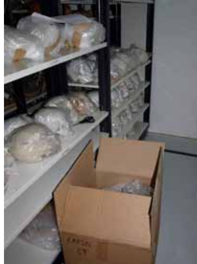
Desembalatge i ordenació per números de les còpies de cranis humans

total de 124 objectes, la majoria d'antropologia i etnologia, s'han guardat en millor condicions.