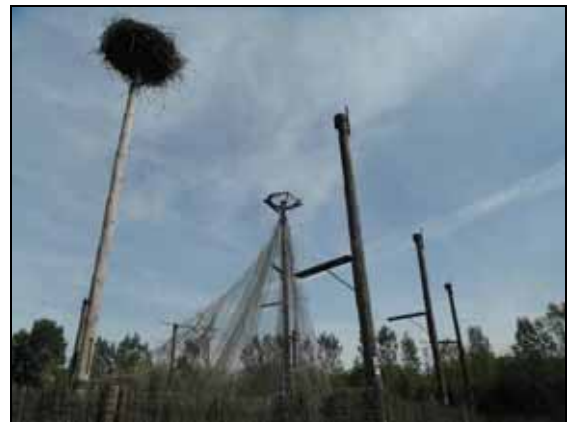
Desmantellament segon aviari