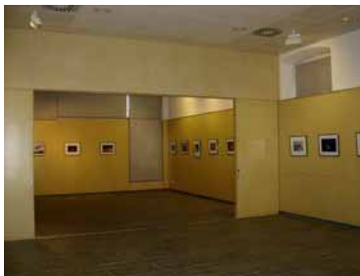
6. Concurs de Fotografia de la Natura