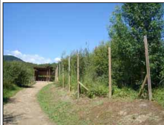
Tanca de bruc robada