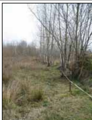
Estat del filat abans de l'actuació