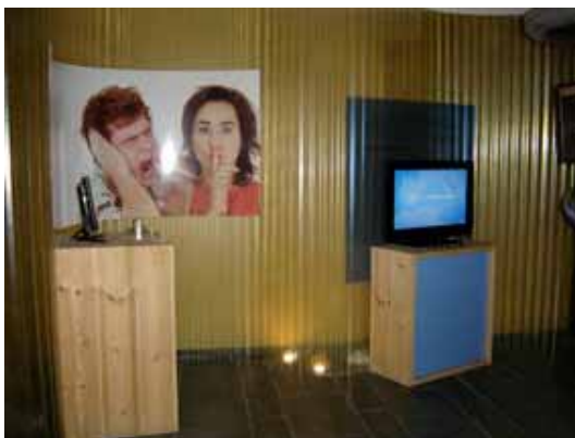
5. Veus de la Mediterrània