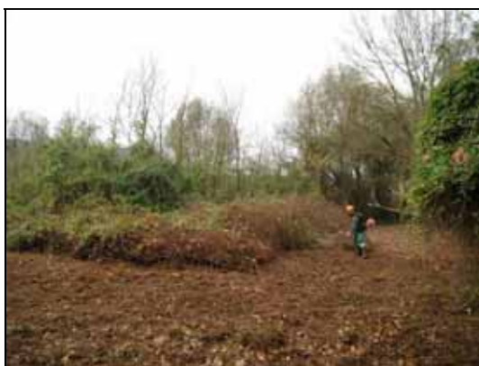
Desbrossat de plantes enfiladisses