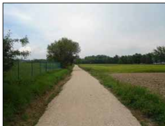
Camí Vell de Can Morgat