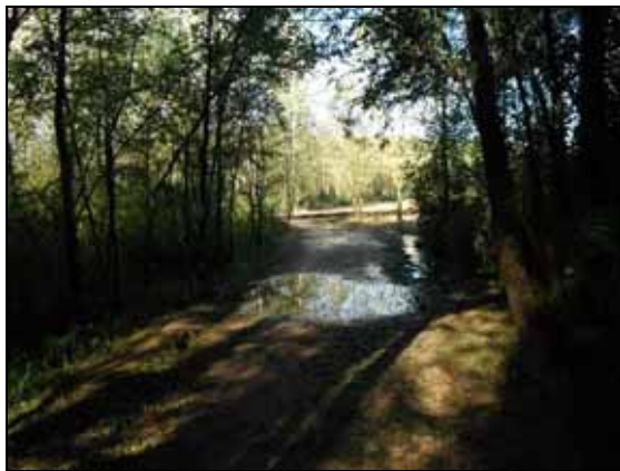
Bassal al mig del camí

S'ha arranjat part dels camins principals d'aquesta xarxa d'itineraris que estaven malmesos. S'han realitzat tasques de retirada de fangs en zones embassades, retirada de terres acumulades, neteja de cunetes taponades, aportació de sauló a les zones a millorar i anivellació del terreny on ha estat necessari.