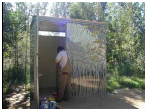
Treballs de neteja dels lavabos