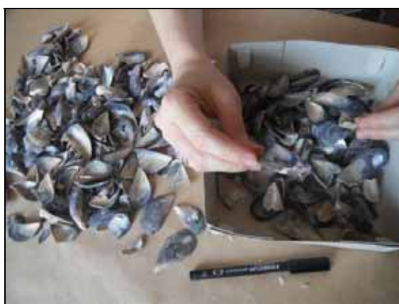
Estudi de la col·lecció d'Empúries

Els resultat de l'estudi i les dades analitzades amplien el coneixement sobre les poblacions recents i antigues de les nàiades de la zona lacustre, de manera que permeten disposar de noves directrius per desenvolupar futurs plans d'acció i regeneració.