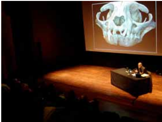
1. Xerrada de Marc Boada