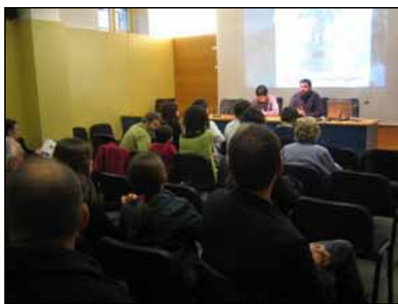
Presentació de la diada

Com cada any, la primera part de les xerrades s'ha destinat a la presentació de treballs de recerca naturalista realitzats per estudiants de batxillerat. La resta de la diada s'ha centrat principalment en divulgar el patrimoni cultural de la comarca associat a les zones humides. Concretament s'ha explicat el jaciment del Parc Arqueològic-Poblat Neolític de la Draga, unes restes arqueològiques que s'han mantingut intactes des de fa més de 7.000 anys gràcies a l'ambient humit on han restat tots aquest temps. Les xerrades s'ha complementat amb una visita diumenge al matí al Parc Arqueològic.