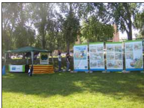
Parada de difusió del Projecte Estany

L'edició d'aquest 2011 s'ha centrat en la problemàtica de les espècies exòtiques invasores lligat amb les accions de comunicació del "Projecte Estany". Enguany el Dia de l'Estany ha coincidit amb la Cloenda de l'Esport escolar organitzat pel Consell Esportiu del Pla de l'Estany i s'han preparat les activitats conjuntament. La diada sempre acaba amb l'alliberament d'un animal, un esparver i 2 ànecs collverds en aquest cas. Exemplars provinents del Centre de Recuperació de Fauna Salvatge de Torreferrussa.