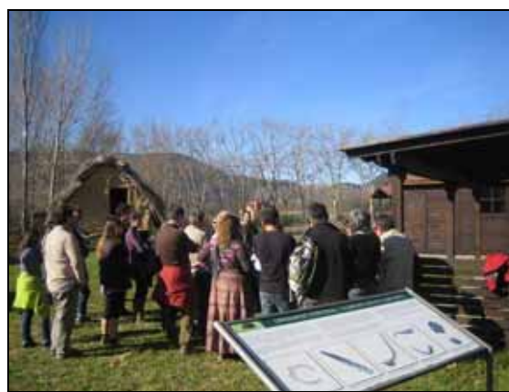
Visita al Parc Arqueològic de la Draga