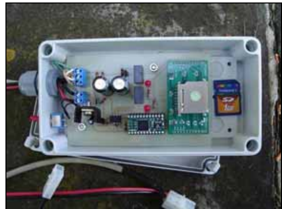
Enregistrador de dades