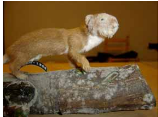
Aparició de fongs en una peça de l'exposició permanent per l'augment d'humitat provocat per la inundació.