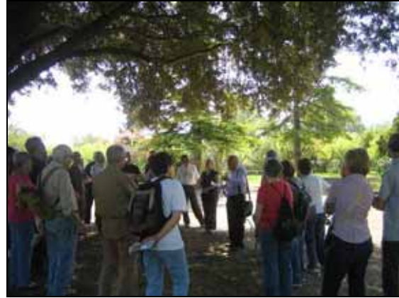
Participants a la sortida

El Consorci ha participat en una de les sortides dins el cicle de sortides "Conèixer el Pla de l'Estany" organitzat pel Centre d'Estudis Comarcal de Banyoles. A la jornada, que ha tingut lloc el dia 10 d'abril, els visitants han pogut veure una demostració de com ferrar una roda de carro i s'ha fet una visita a les instal·lacions i jardins de la finca de Casa Nostra. La sortida ha conclòs amb una visita a la parella de cigonyes nidificants i amb una explicació del projecte de reintroducció de cigonya al Pla de l'Estany que s'està duent a terme a la zona des del 2006.