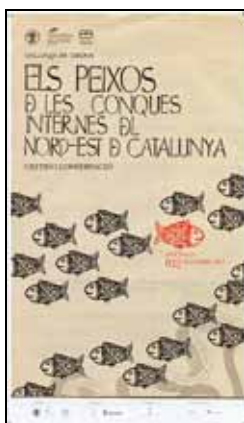
Cartell del col·loqui

La jornada ha tingut lloc el dia 2 de desembre de 2011 a la sala de socis del Club Natació Banyoles. Una quarantena de persones han participat a la jornada.