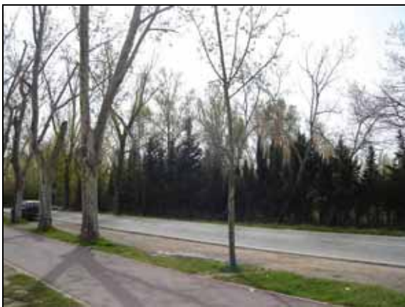
Vista de la zona abans de l'actuació