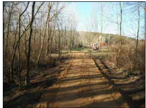
Manteniment de camins