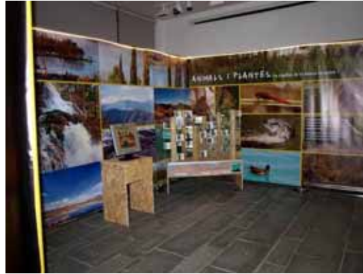
2. El cost del benestar