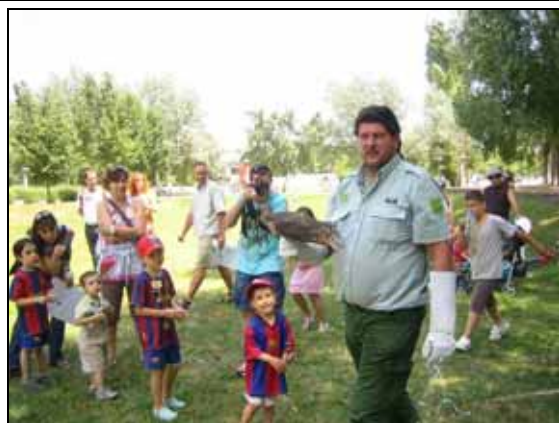
Alliberament d'un esparver