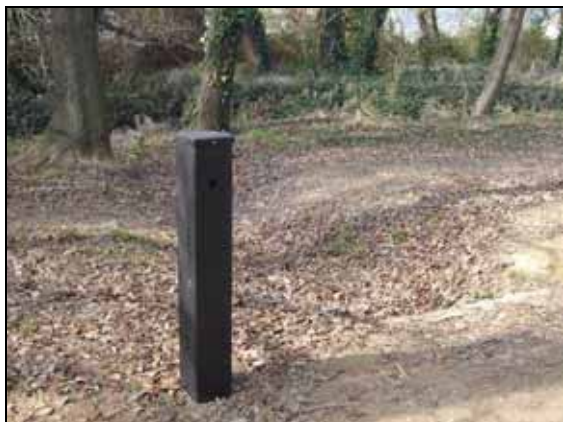
Suport del sensor de moviment

Actualment s'estan processant les dades dels 3 comptadors instal·lats, per tal d'obtenir-ne uns resultats representatius i poder disposar d'uns valors globals de freqüentació de l'entorn immediat de l'Estany de Banyoles.