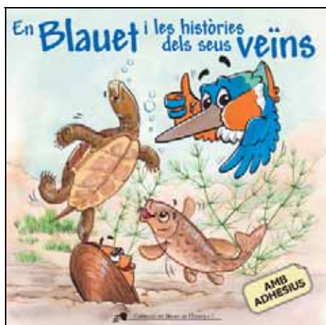
Portada del conte

Gràcies al Projecte Estany, s'ha editat el setè conte de la col·lecció En Blauet de l'estany . Aquesta col·lecció es va iniciar el 2004 com a element de difusió dels valors naturals entre els infants del Pla de l'Estany. El nou conte, amb una edició de 1.500 exemplars, porta per títol " En blauet i les històriques dels seus veïns " i tracta la problemàtica de les espècies exòtiques invasores de l'Estany de Banyoles, lligant la temàtica amb el Projecte Estany. En aquesta ocasió i com a novetat, el conte ha incorporat una làmina d'adhesius de les principals espècies autòctones i introduïdes, per completar les fitxes de fauna i flora del conte. Per poder aconseguir la làmina, els infants han hagut de portar un dibuix relacionat amb en Blauet o l'Estany al Museu Darder on se'ls hi ha entregat els adhesius.