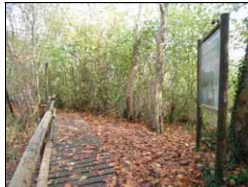
Estat de la zona després de l'actuació