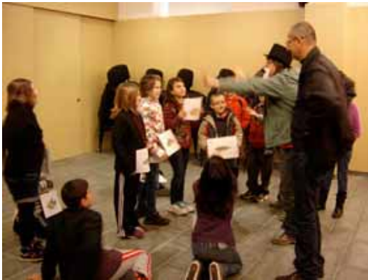
1. Exposició temporal "Aliens!". Taller de primària