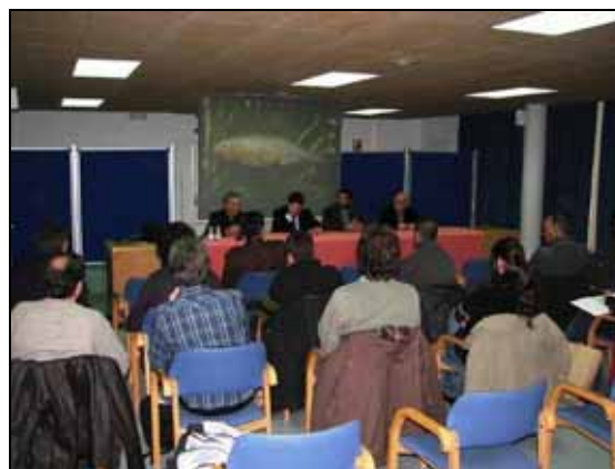
Presentació de la jornada