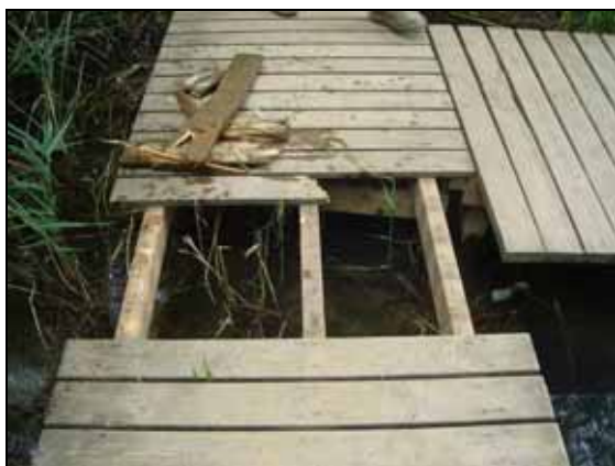
Passera malmesa al camí de Goma

El manteniment, neteja i higienització del mòduls dels lavabos ha estat possible gràcies al finançament provinent del "Trasllat d'actuacions" (veieu apartat 1).