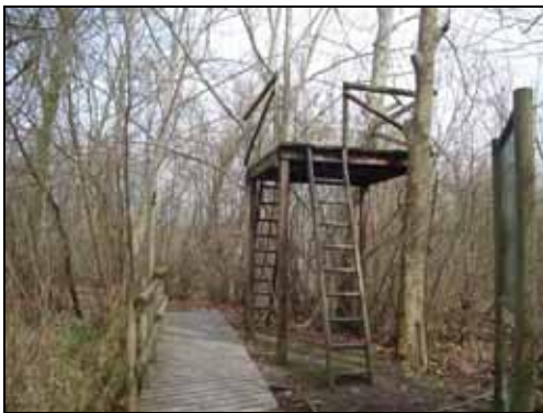
Torre mirador abans de l'actuació

L'actuació ha estat possible gràcies a la subvenció concedida al Consorci pel projecte de "Gestió sostenible dels hàbitats de la zona humida del Pla dels Estanyols".