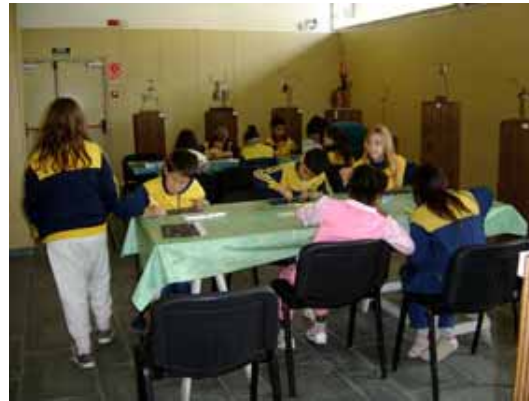
2. Taller d'egagròpiles.