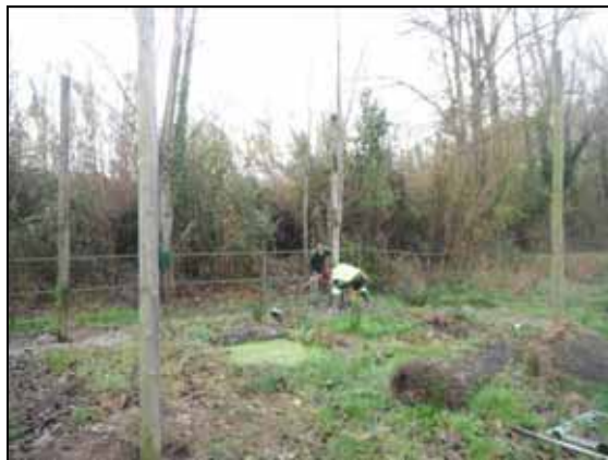
Desmantellament del primer aviari

En previsió de l'establiment de noves parelles, s'han deixat 3 pals de fusta de 4 metres de llargada com a punts de parada o per més endavant, si cal, instal·lar-hi nous nius.