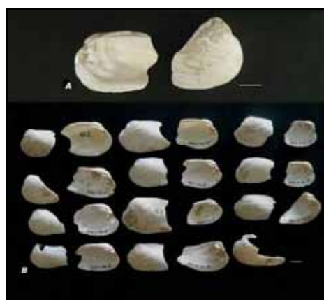
Potomida littoralis del Reclau Viver