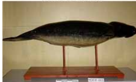
després de la restauració